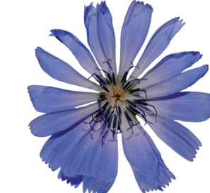
PORDENONE 21 MAGGIO