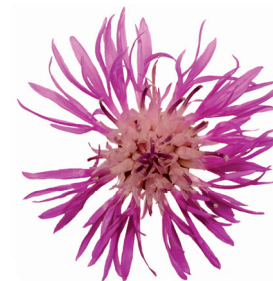
CORDENONS 14 MARZO