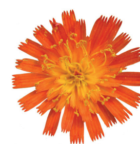
SPILIMBERGO 10 APRILE