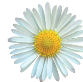
PRATA 15 APRILE