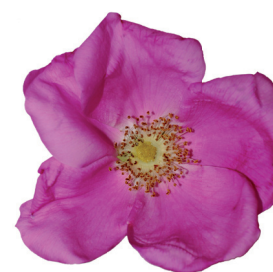
SESTO AL REGHENA 9 MAGGIO