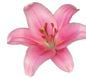
AVIANO - 23 APRILE PORDENONE - 24 APRILE