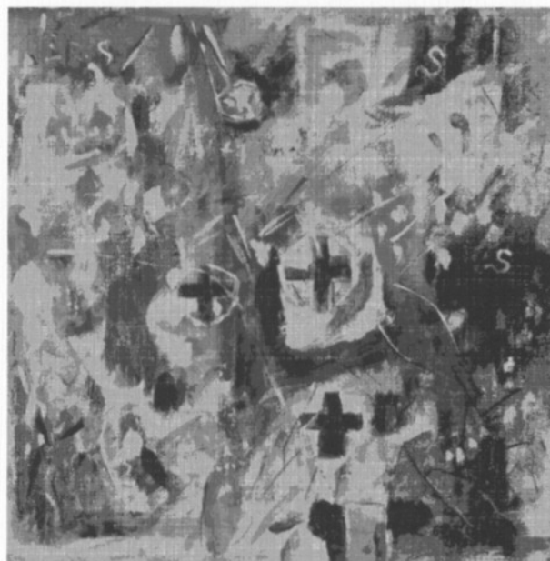
Sulle tracce del tempo